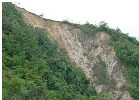
L'érosion par ravinement rend les environs dangereux pour habitants, faune et flore

Depuis des années, pour faire face aux besoins croissants en céréales, les agriculteurs ont dû rompre avec les méthodes de rotation, au profit des semences continues. Ces modifications de gestion des exploitations ont contribué à accélérer cette érosion en nappe.