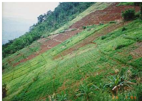
Les haies limitent le ruissellement des eaux de pluie de 40 à 70% (Vetiver.org, 2009)

Ces haies protègent les cultures proches du vent et peuvent empêcher les dépôts de limons en bordure de rivière ou de lac.