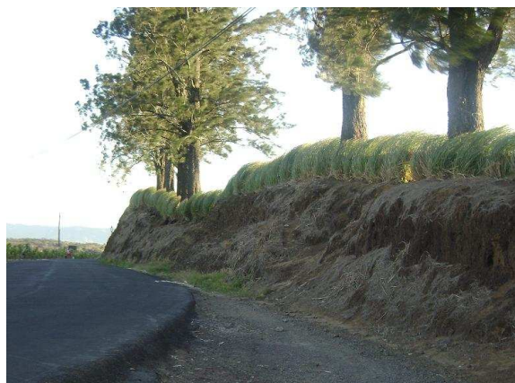
Cette bordure de route en Vétiver a coûté 4€ par mètre linéaire contre 100€/ml s'il avait fallu la réaliser en béton

Régulièrement disposées perpendiculairement à la pente, dans les cultures, les haies de Vétiver constituent des barrières vivantes qui retiennent les sédiments, la terre délavée et l'humidité en surface tout en diminuant la vitesse de l'eau. Cela permet une infiltration vers les nappes phréatiques réduisant ainsi le ruissellement et donc l'enlèvement des couches de terres fertiles et superficielles du sol (érosion en nappe). Un cercle vertueux naît.