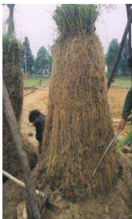
Avec des racines de près de 4 m en profondeur, au bout de 3 ans, le Vétiver s'apparente à un iceberg